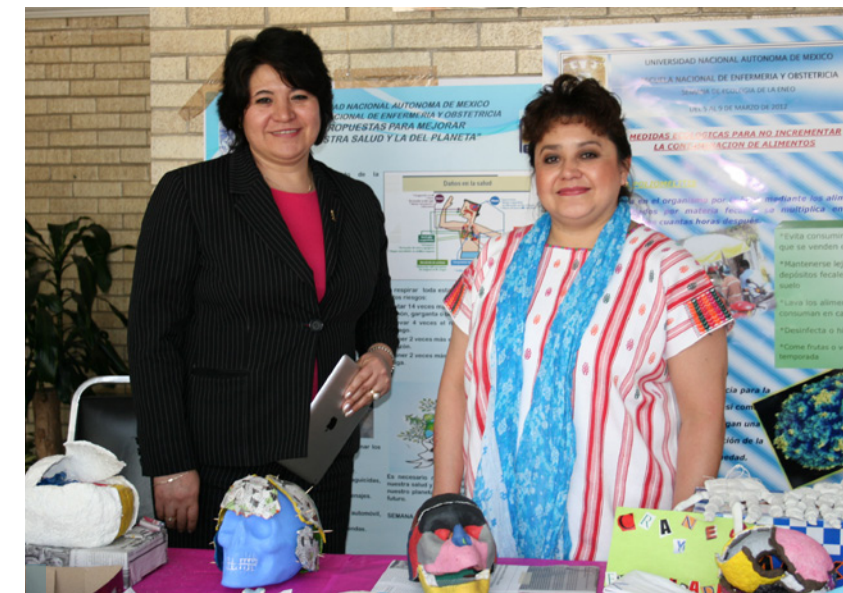
La comunidad de la ENEO participó con entusiasmo en la Semana de Ecología 2012.

Finalmente, queremos mencionar que con este número de Acontecer Académico continuamos nuestro proceso de renovación con el que intentamos establecer una imagen acorde a las necesidades de comunicación interna y externa de nuestra Escuela, lo cual esperamos sea del agrado de nuestros lectores con quienes buscaremos establecer mecanismos de retroalimentación en aras de mejorar este medio de información para toda la comunidad ENEO. ■■■