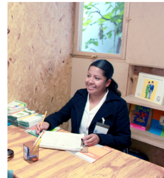
Una parte fundamental del Modelo API es la labor realizada en el consultorio para la atención de la comunidad de la Escuela.