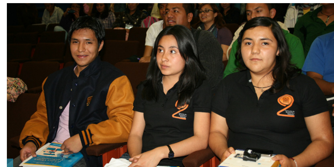
Los ganadores de los tres primeros lugares del certamen fueron reconocidos por docentes y alumnos.

Fue un gran éxito el segundo concurso de Anatomía y Fisiología humana que se llevó a cabo del 11 al 13 de abril, en las instalaciones de la ENEO, cuyo tema desarrollado fue “Sistema Nervioso, Tejido nervioso, Sistema nervioso periférico, Sistema nervioso central, Sistema límbico, Sistema vegetativo”.