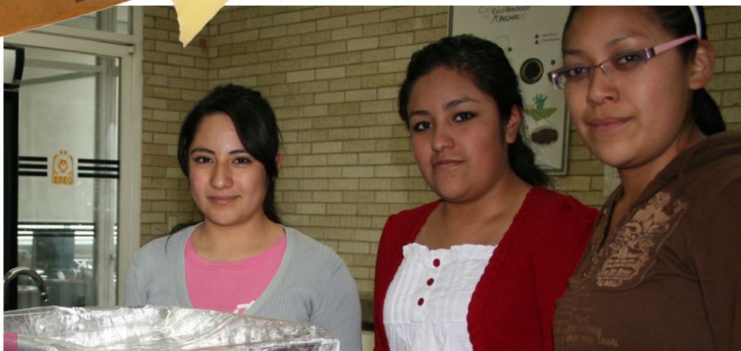
Los alumnos tuvieron un papel protagónico en la Semana de Ecología 2012.