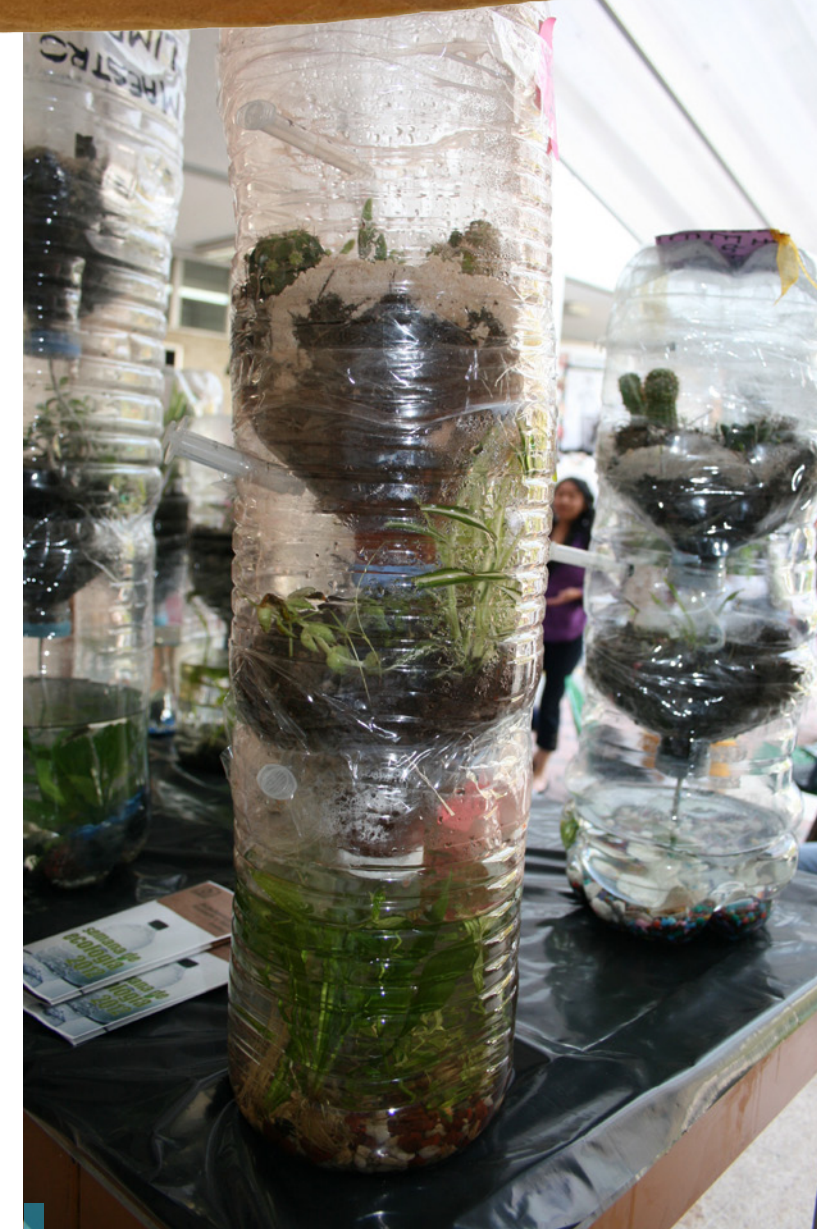
Con envases de PET se crearon terrarios y acuarios.

Los programas pro-ambientales, requieren de estrategias que contemplen conductas específicas, en condiciones facilitadoras y que los individuos que las van a ejecutar las perciban como sencillas.