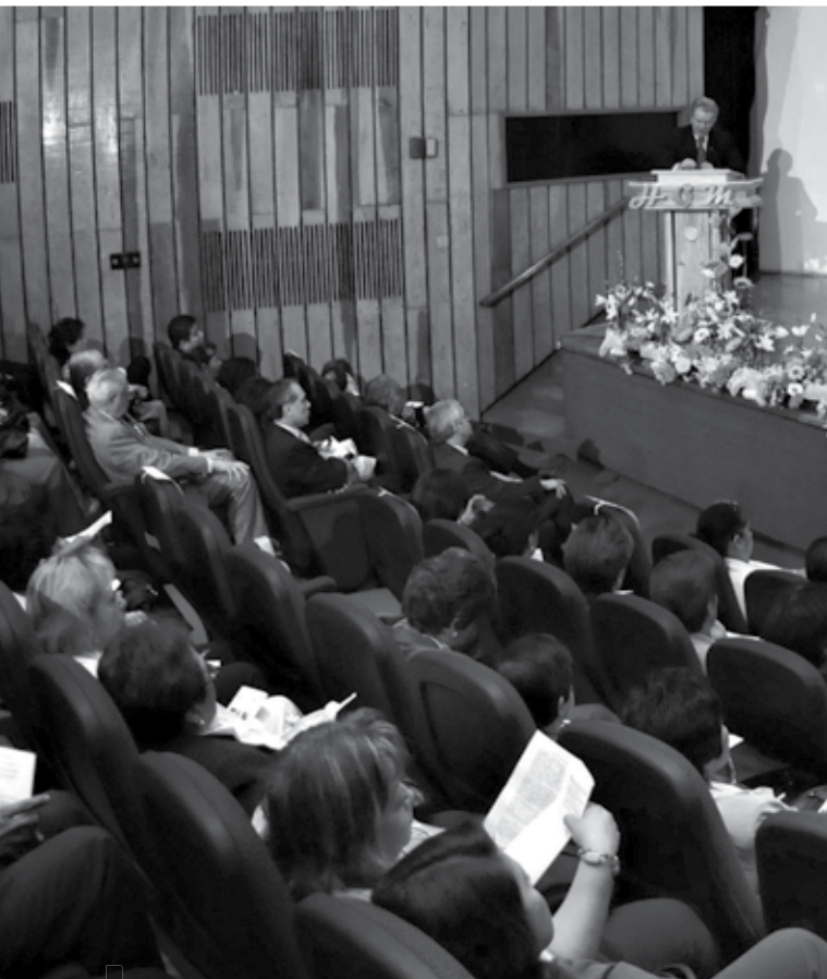
Profesionales y funcionarios del sector salud, analizan las tendencias de la enfermería.

Este déficit de profesionales se registra en una época donde paradójicamente se avecinan necesidades apremiantes de