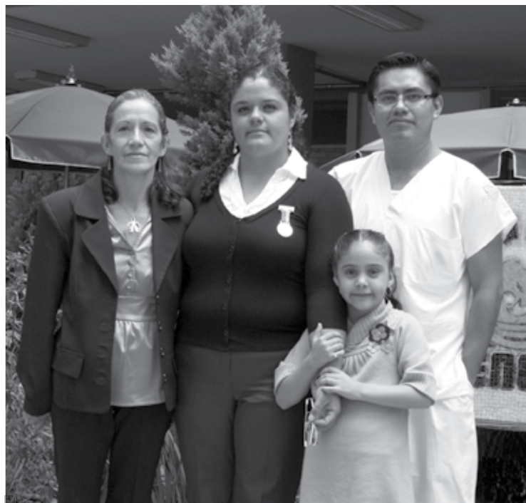
La destacada alumna acompañada de su madre, esposo e hija.