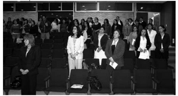
En el Aula Magna de la ENEO

Cabe resaltar que en el panel foro titulado: “La incorporación de la perspectiva de género en la carrera de Enfermería en la UNAM”, participa-