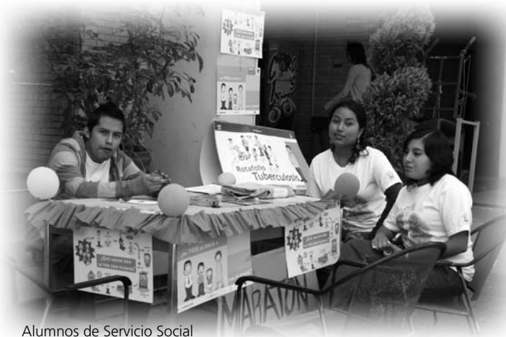
Alumnos de Servicio Social