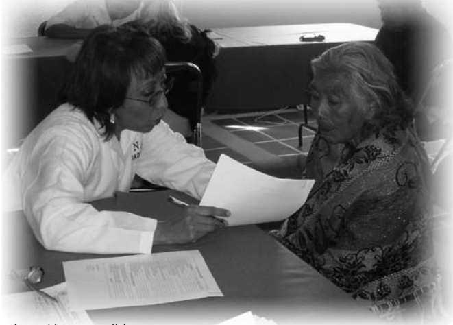
Atención con calidez