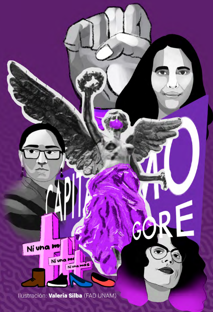
Ilustración: Valeria Silba (FAD UNAM)

Sigue la transmisión: Igualdad de Género UNAM